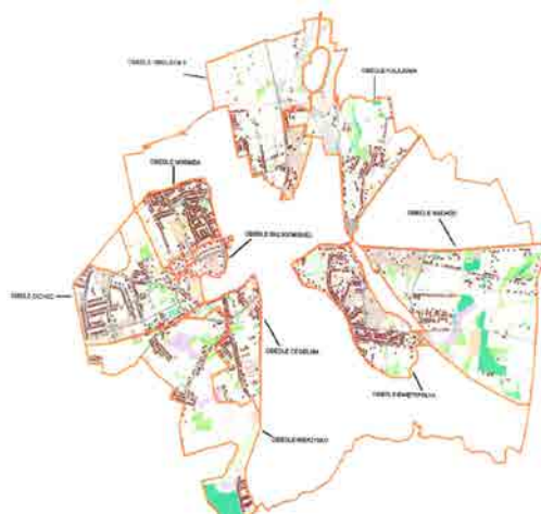
Identyfikacja obszarów rewitalizacji w województwie pomorskim - Kościerzyna