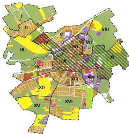
Identyfikacja obszarów rewitalizacji w województwie pomorskim - Starogard Gdański

Analiza wskaźników dotyczyła wszystkich wyznaczonych jednostek w mieście, co też stanowi odzwierciedlenie rekomendacji zawartych w ustawie. Powstałe Raporty z delimitacji