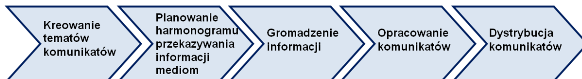
Rys. 5. Model pracy komórki odpowiedzialnej za działania informacyjno-promocyjne Funduszy Europejskich

Działania będą polegały m.in. na utrzymywaniu dobrych, stałych kontaktów z mediami regionalnymi i lokalnymi, opracowaniu i uaktualnianiu listy dziennikarzy zajmujących się tematyką FE oraz przesyłanie im informacji dostosowanych do tematyki i charakteru danego medium. W kontaktach z przedstawicielami mediów stosowane będą metody, służące zainteresowaniu środowiska dziennikarskiego problematyką FEP 2021-2027, typu briefing czy spotkania dla prasy.