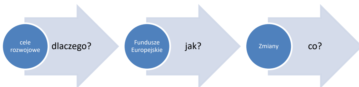
Rys. 2. Schemat: Jak formułować przekaz na temat Funduszy Europejskich?

Kiedy przystępujemy do tworzenia przekazu o FE, powinniśmy posługiwać się uniwersalnym schematem (rys. 2). Nie ma znaczenia to, czy są to działania informacyjne czy promocyjne i do kogo je kierujemy.