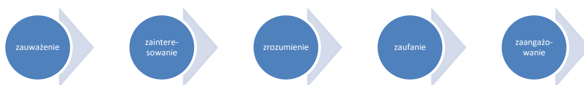
Rys. 3. Etapy schematu komunikacji 5Z

WAŻNE: Kiedy planujemy i realizujemy działania komunikacyjne, powinniśmy skoncentrować się na tym, aby osiągnąć co najmniej poziom zrozumienia. Jest to minimum dla komunikacji, którą kierujemy do wszystkich grup docelowych w obecnej strategii. Kluczowe w tym procesie jest rozumienie przekazu, czyli właściwa identyfikacja korzyści, które wynikają z Funduszy Europejskich.