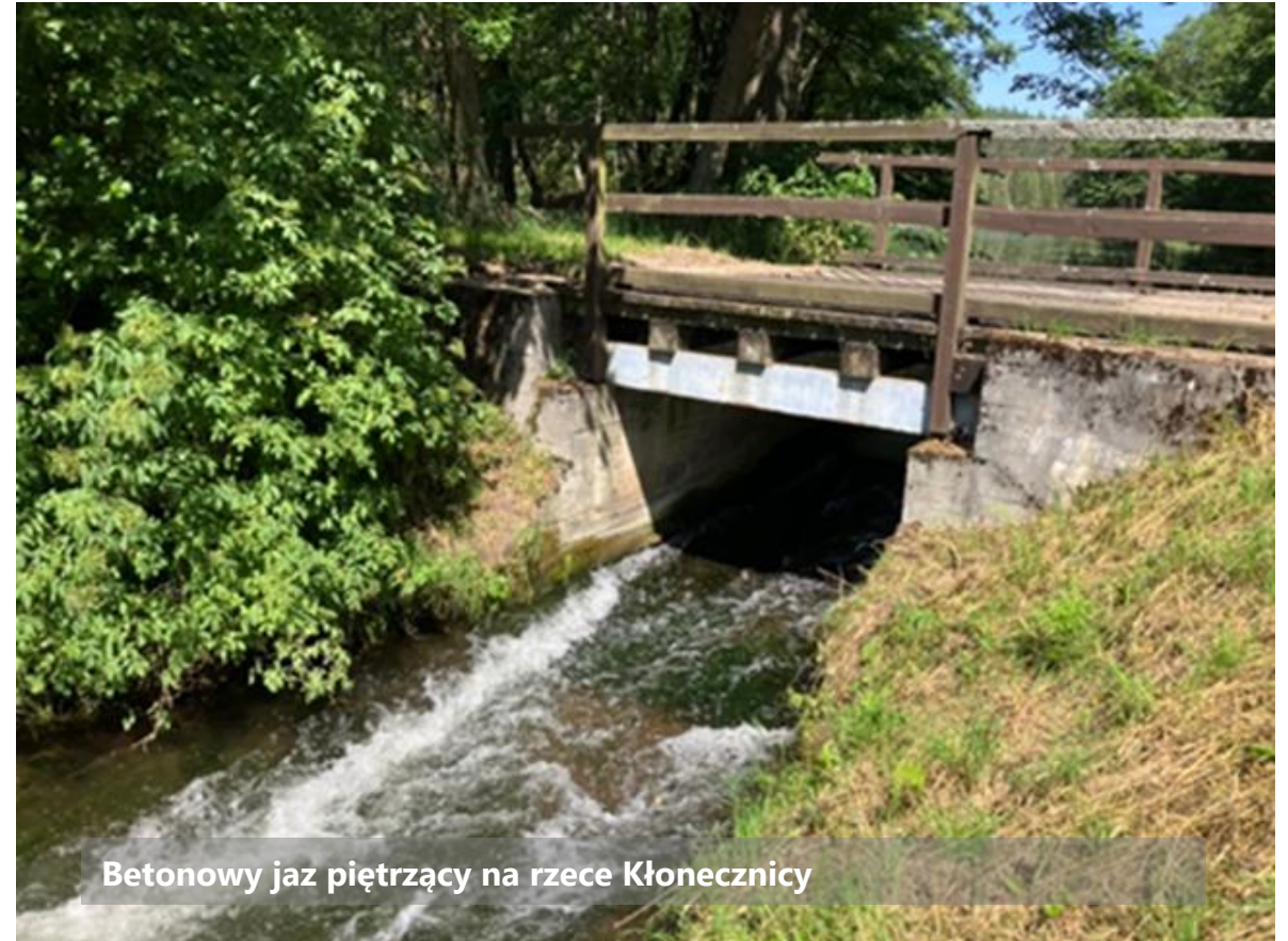
Betonowy jaz piętrzący na rzece Kłonecznicy