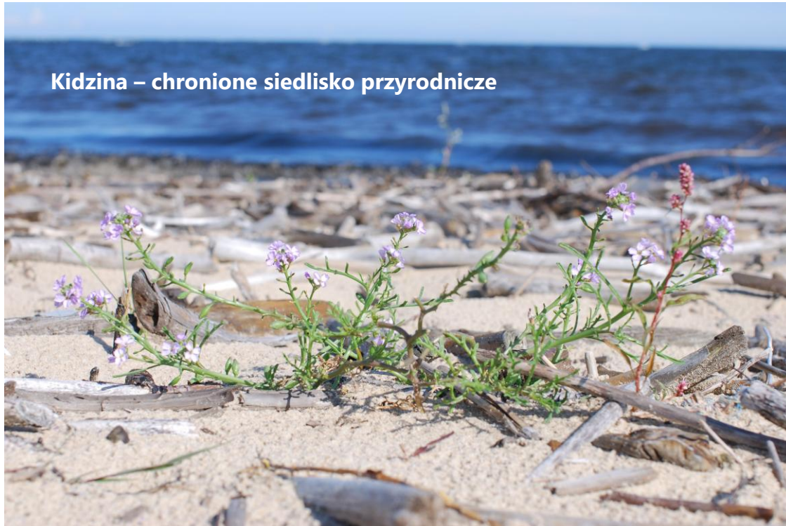
Kidzina – chronione siedlisko przyrodnicze