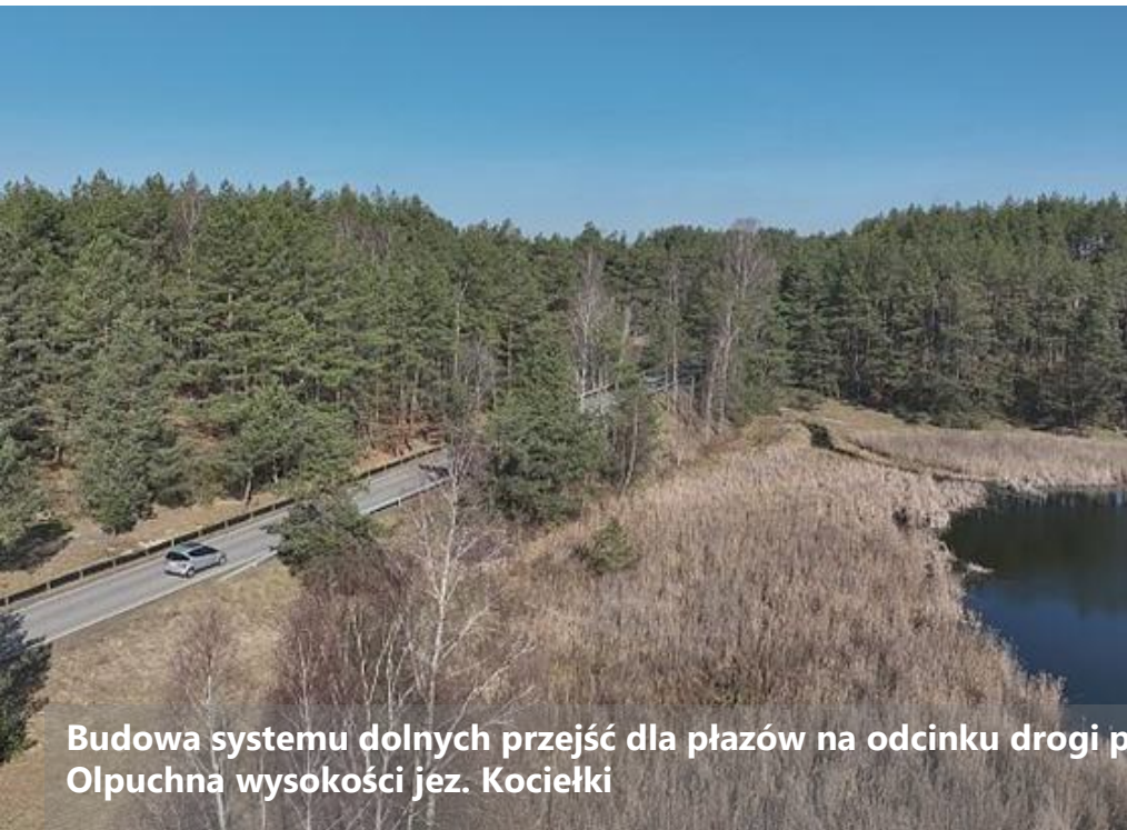
Budowa systemu dolnych przejść dla płazów na odcinku drogi powiatowej nr 2403G Kościerzyna-Wdzydze Kiszewskie-Olpuchna wysokości jez. Kocietki