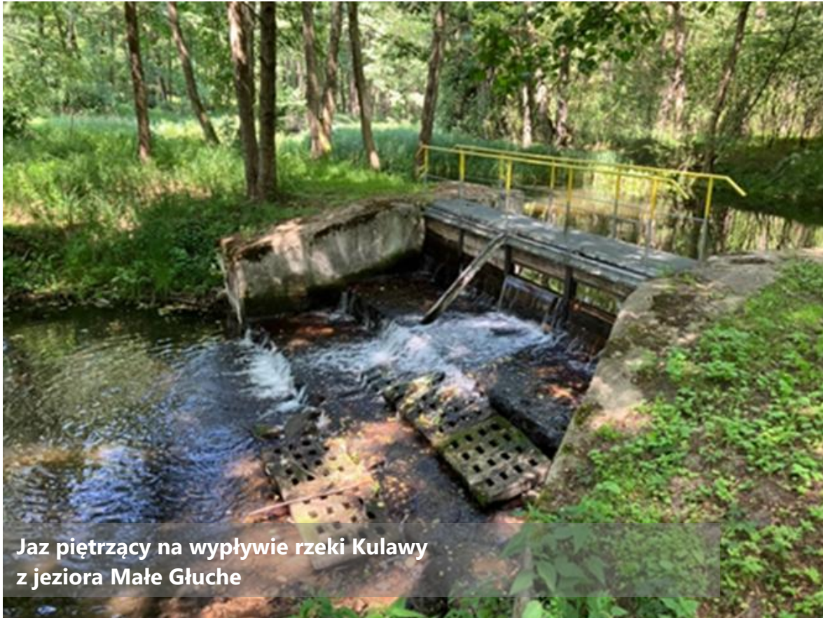
Jaz piętrzący na wypływie rzeki Kulawy z jeziora Małe Głuche