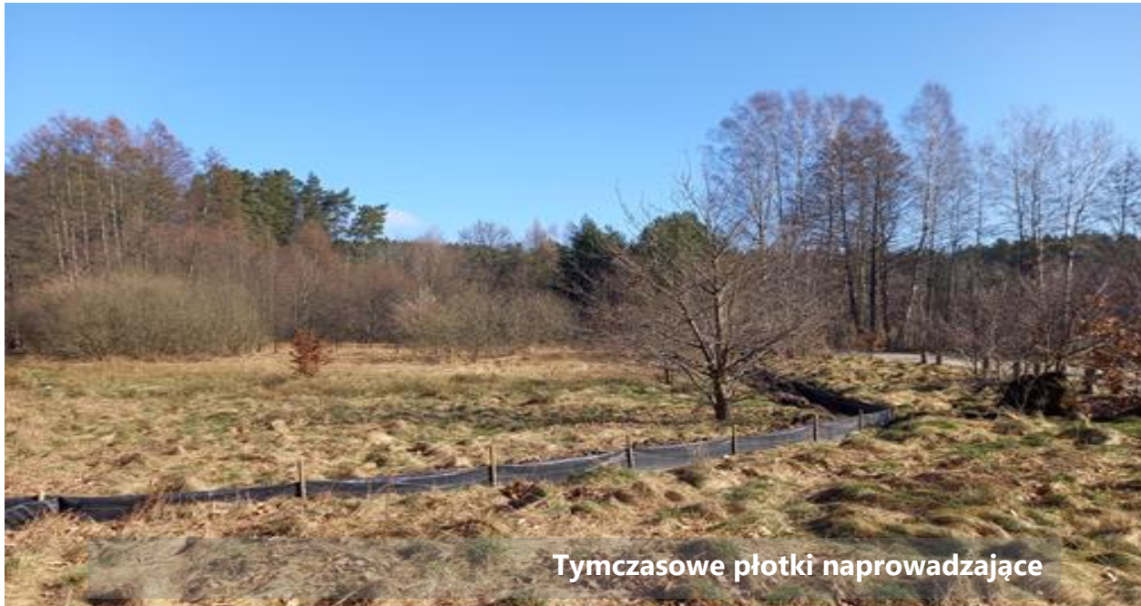
Tymczasowe płotki naprowadzające