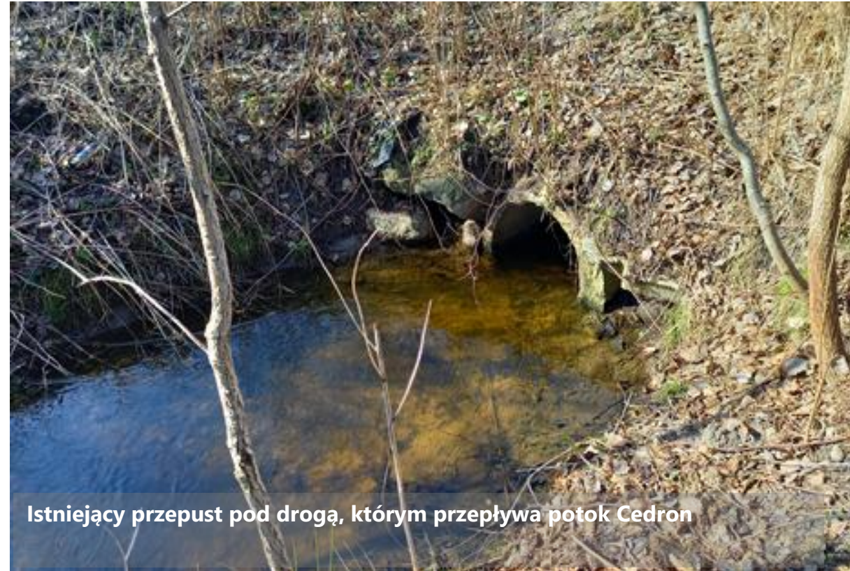
Istniejący przepust pod drogą, którym przepływa potok Cedron