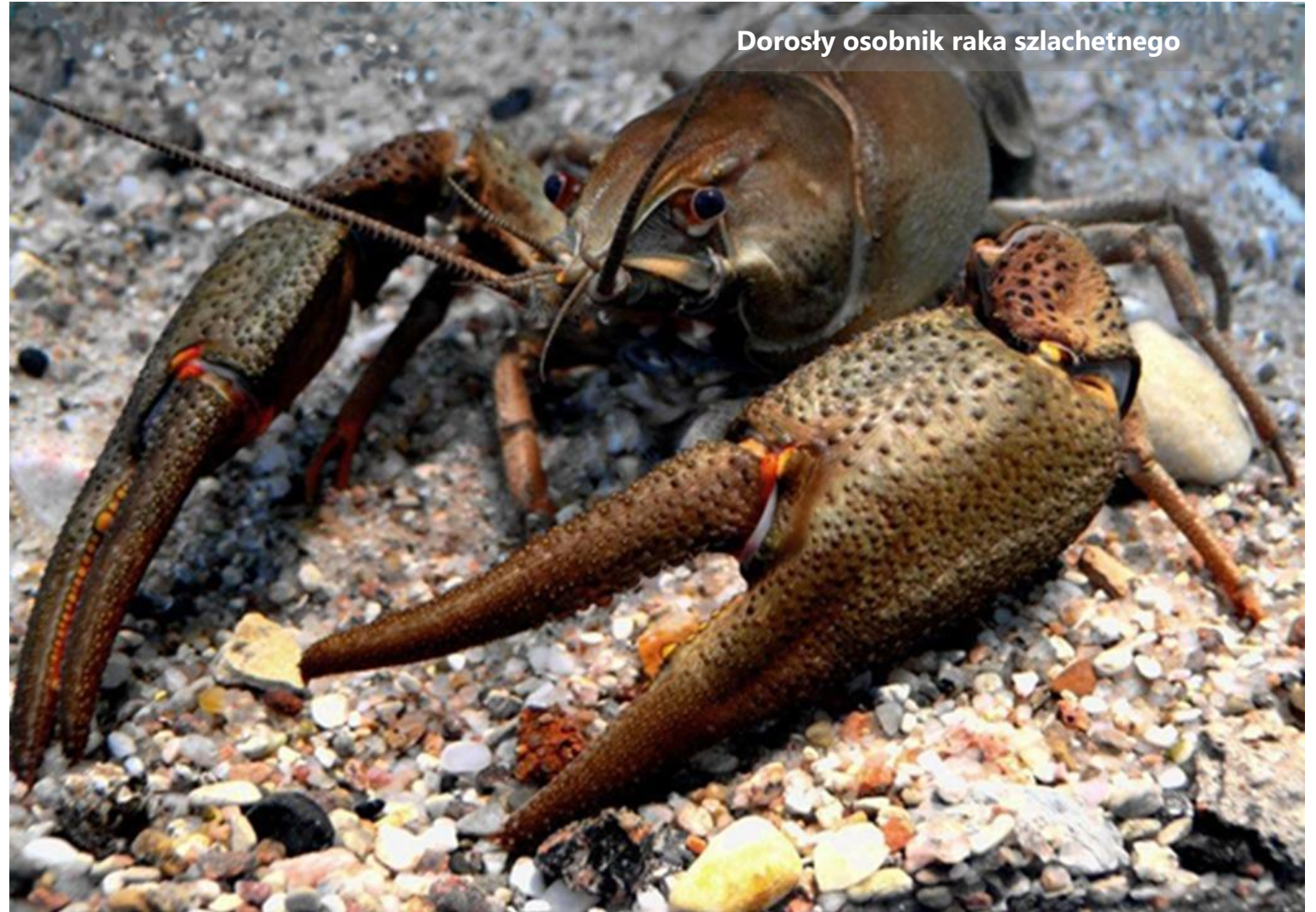
Dorosły osobnik raka szlachetnego