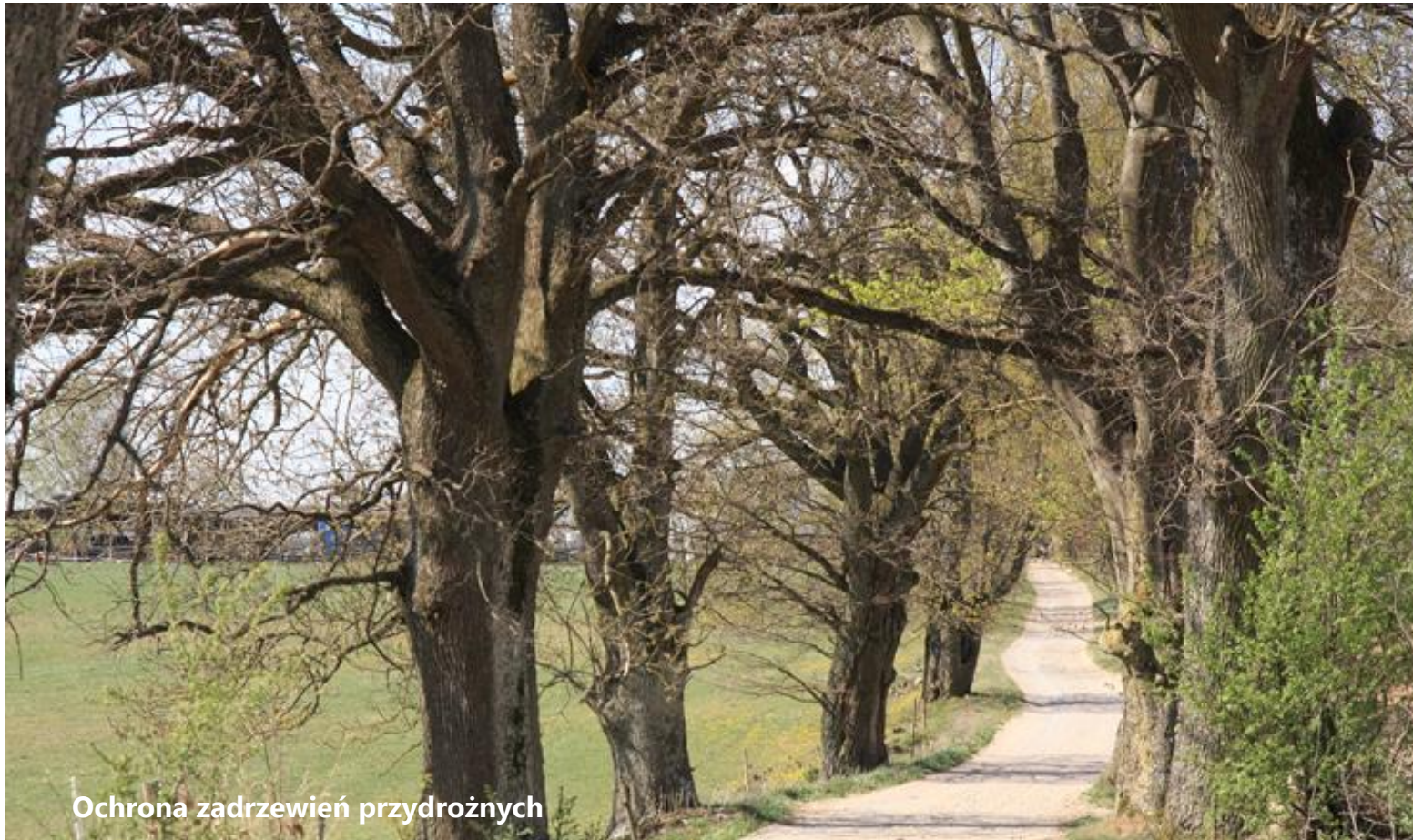
Ochrona zadrzewień przydrożnych