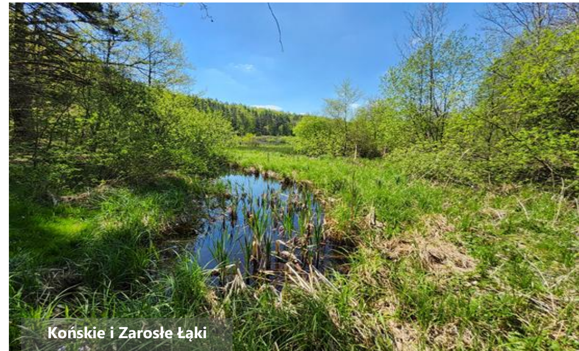
Końskie i Zarosłe Łąki